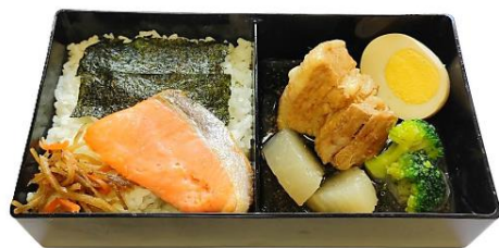
のり鮭ごはん／豚バラ大根煮

ニチワブースにてニュークックチルのご試食を御用意しております。 この機会に是非、 スチコン式再加熱機器 による料理の仕上がりをご確認下さい。