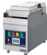
電気オートグラム シェルグドル TEGC-5D-1