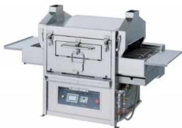
電気スチーム コンベヤーオープン NECO-11L