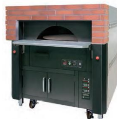
電気式ピザ窯 エレフォルノ PK-14.5B