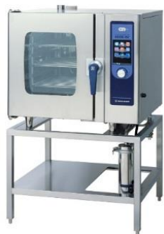
電気スチーム コンベクションオープン SCOS-61RY