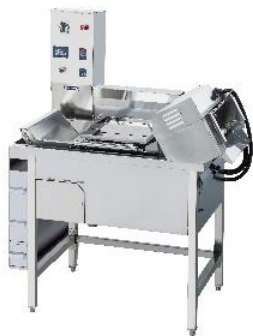
赤外線連続フライヤー EFCH-8LN