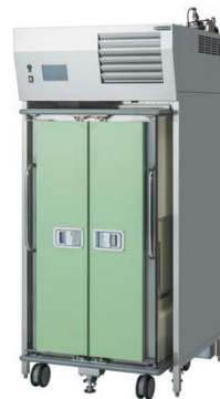
スチコン式再加熱カート RHS-26