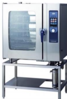
電気スチーム コンベクションオープン SCOS-1010RY