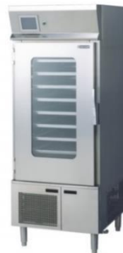
電気ヒートウォーマー キャビネット RHW-720