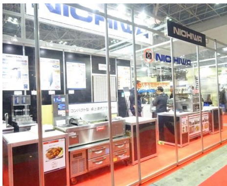
ニチワ電機 展示ブースの様子(2018年2月20日~23日)