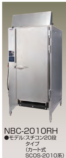
NBC-2010RH ●モデル: スチコン20段タイプ (カート式 SCOS-2010系)