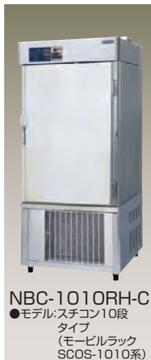
NBC-1010RH-C ●モデル: スチコン10段タイプ (モービルラック SCOS-1010系)