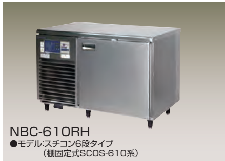
NBC-610RH ●モデル: スチコン6段タイプ (棚固定式SCOS-610系)