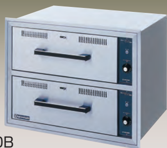
CDW-900B (ビルトインタイプ)