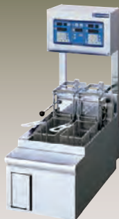
TEFD-13N-2L-D (1槽 2バスケットタイプ)