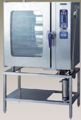
SCOS-1010RL-R(L) 1/1ホテルパン 10段