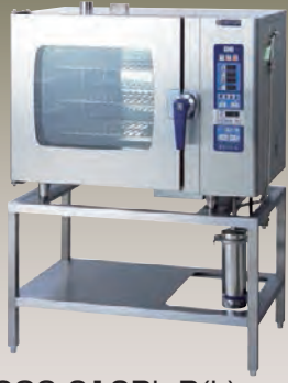
SCOS-610RL-R(L) 1/1ホテルパン 6段

●機器のイニシャルコスト削減を可能にしたRLタイプは、インJECTION方式で、スチーマーモードの庫内温度立ち上がりをスピードアップ、同時にスケールトラブルも改善しました。