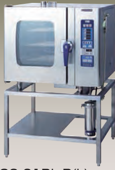
SCOS-61RL-R(L) 1/1ホテルパン 6段