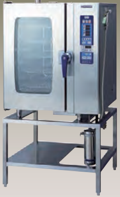
SCOS-101RL-R(L) 1/1ホテルパン 10段