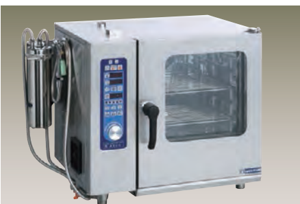
ASCO-5230RL-L(R) (卓上タイプ) 2/3ホテルパン 5段