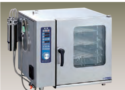
ASCO-51RL-L(R) 1/1ホテルパン 5段