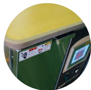
メラミン化粧板仕様