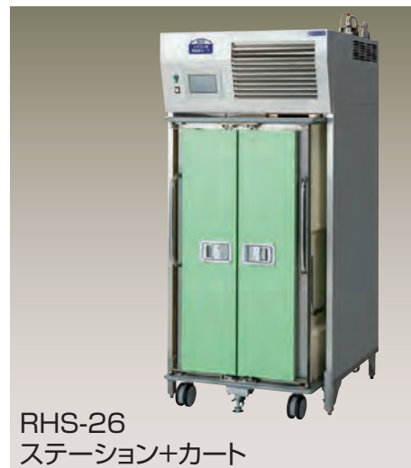
RHS-26 ステーション+カート